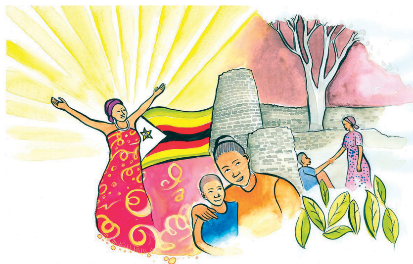
Bild Weltgebetstag: „Rise! Take Your Mat and Walk“ © Nonhlanhla Mathe

Sie haben für den Weltgebetstag 2020 den Bibeltext aus Johannes 5 zur Heilung eines Kranken ausgelegt: „Steh auf! Nimm deine Matte und geh!“, sagt Jesus darin zu einem Kranken. In ihrem Weltgebetstags-Gottesdienst lassen uns die Simbabwerin-