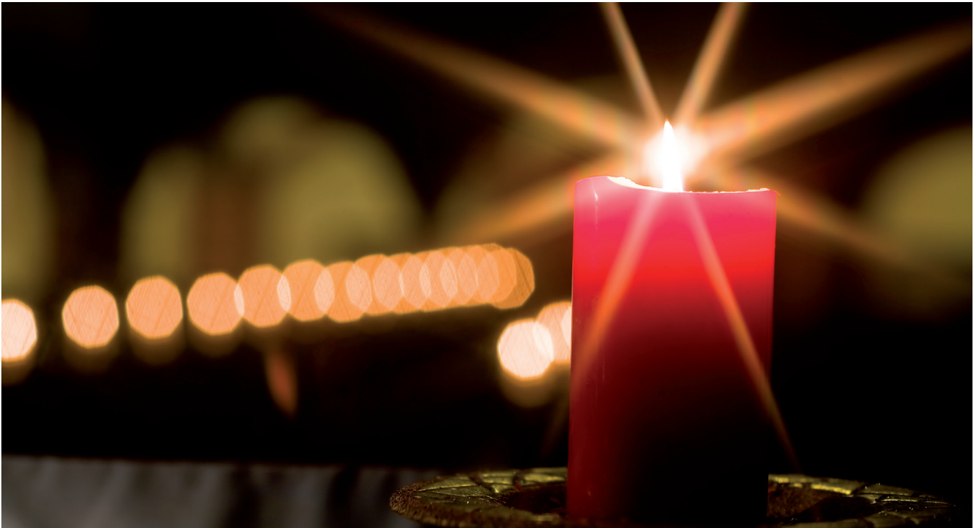
Die Kerze, Licht der Hoffnung